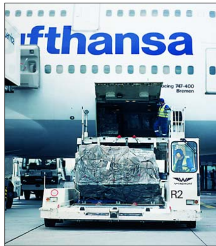
Frachtschlag am Frankfurter Flughafen

Nach alter Lesart in den IATA-DGR 2004 war laut Verpackungsvorschrift 602 für UN 2814 und 2900 eine Verpackung mit adäquater Festigkeit ausreichend. Nun fordert die neue, restriktiver gefasste Verpackungsvorschrift 602 eine feste Außenverpackung ( rigid outer packaging of adequate strength ).