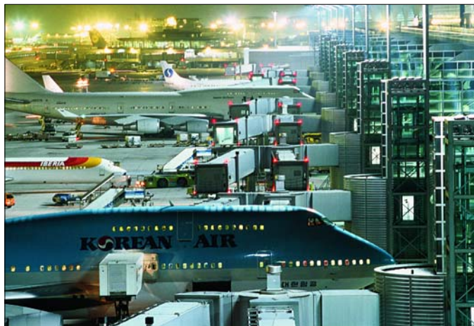
Die Zahl der Personalkategorien bei Schulungen nach IATA-DGR ist gestiegen. So muss ab sofort jeder, der für eine Spedition an einem Flughafen tätig ist, wenigstens Gefahrgut-Grundkenntnisse besitzen.

Alle zwölf Personalkategorien lassen sich den Rubriken: Versender/Verpacker, Speditoren, Luftverkehrsgesellschaften/Frachtabfertigungsagenten sowie Personal für die Sicherung (Security) zuordnen. Es ist empfehlenswert, die geänderte Tab. 1.5.A zu studieren und die einzelnen Änderungen vor al-